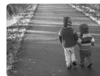
La santé de l'enfant, approche multidimensionnelle

éléments informels qui stimulent le jeu dans le paysage naturel ou urbain ou à l'inverse intégrer des caractéristiques du paysage (arbre, pente, relief...) dans la zone de jeux formels. Lorsque c'est possible, évitons de clôturer les aires de jeux afin d'augmenter leur rayonnement et de permettre une meilleure intégration de ceux-ci dans leur contexte général.